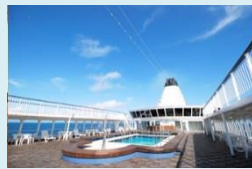
プール&ジャグジー